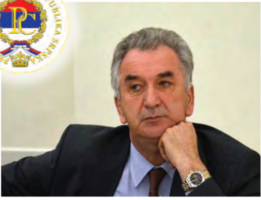
Mirko Šarović (2000. - 2002.)

U mojim očima Narodna skupština svih ovih 25 godina bila je ključna, temeljna institucija Republike Srpske koja je dala pečat njenom stvaranju i poslijeratnom održanju i razvoju. Taj krucijalni značaj uprkos nekim pokušajima da se mjesto