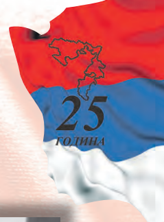
Skupština Srpske Republike BiH, maj 1992.