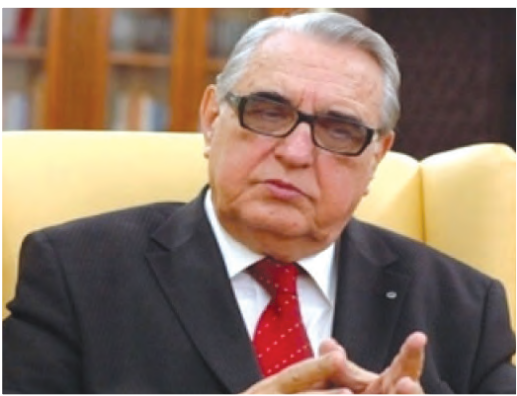
Rajko Kuzmanović (2006. - 2010.)

Svi, od naroda izabrani narodni poslanici, u proteklih 25 godina postojanja Narodne skupštine, neposredno su osnažili i demokratski razvoj Republike Srpske. I oni koji će biti birani, ovjeriće slobodu našega naroda i naše pravo da svoju zajednicu razvijamo, između ostalog i donoseći zakone primjerene vremenu i potrebama napretka države i naroda.