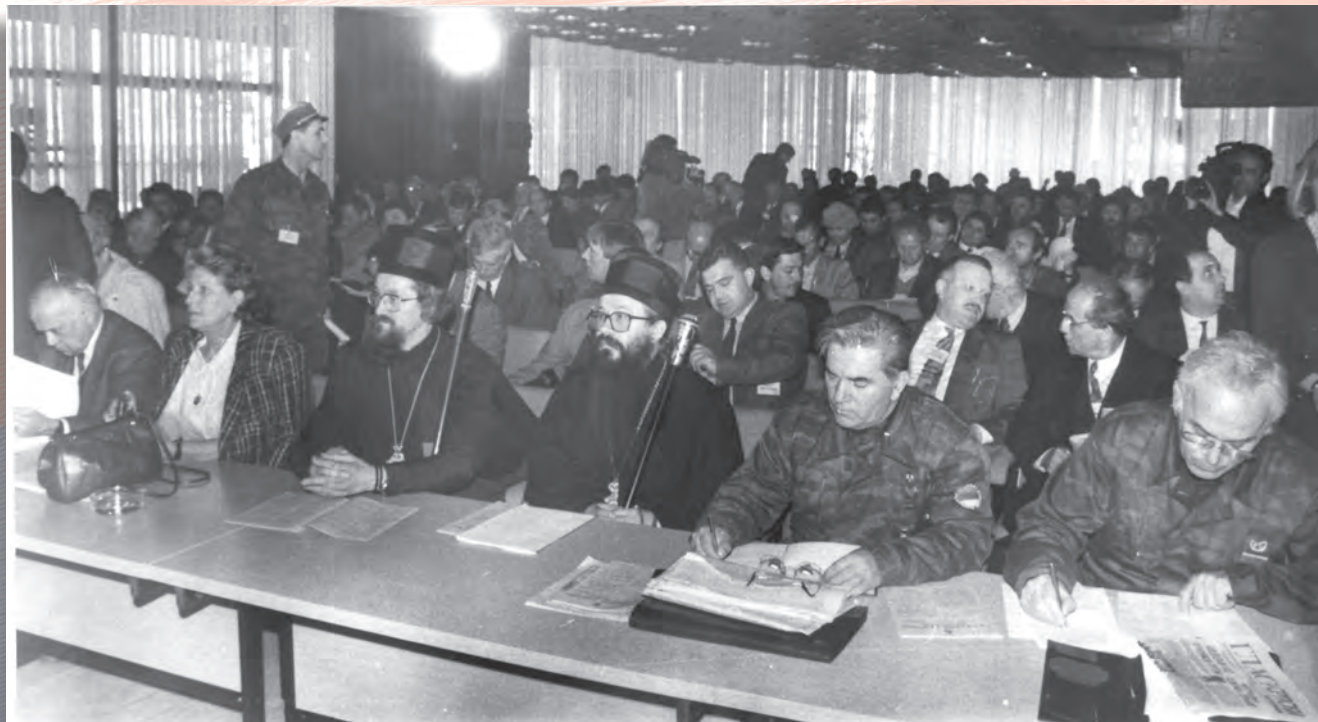
28. redovna sjednica prvog saziva Narodne skupštine održana je u Novom Gradu