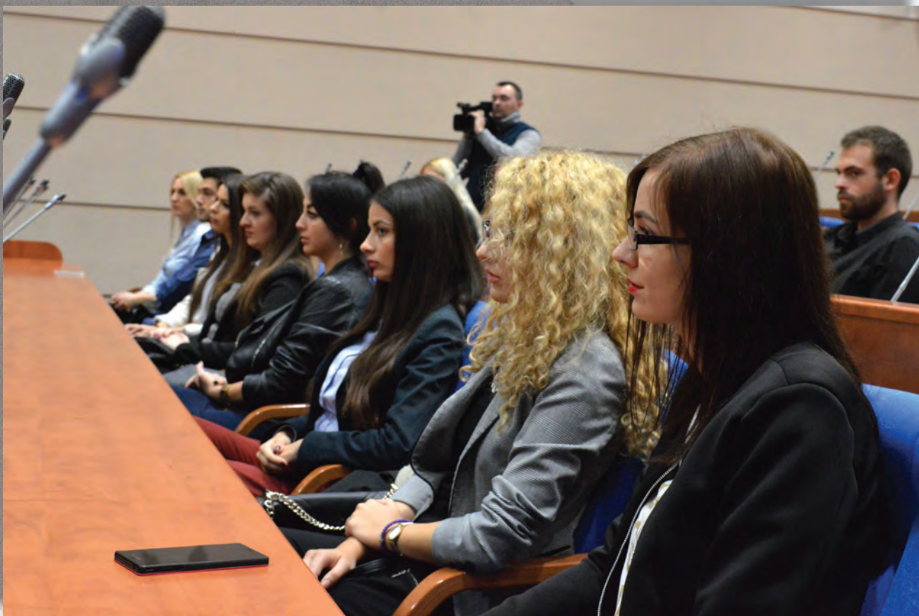
Osamnaesta klasa stažista Narodne skupštine (septembar 2016. godine)