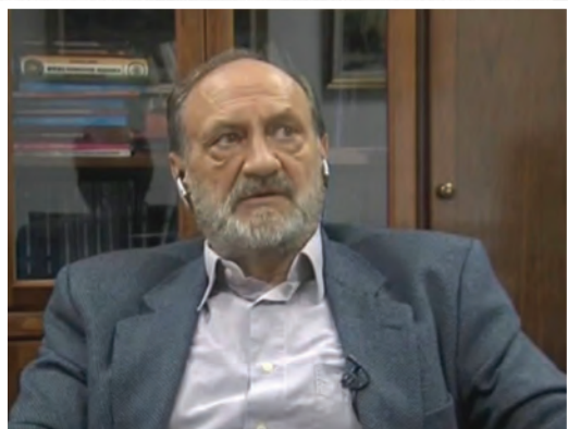
Nikola Poplašen (1998. - 1999.)

Kad se sve to sagleda i stavi i kontekst haosa na terenu, među narodom, i preglasavanja Srba i u Predsjedništvu i tadašnjoj Vladi, jasno je zašto smo 25. oktobra bili prisiljeni da formiramo Skupštinu srpskog naroda. Naprosto, to je bio naš odgovor na pravno nasilje koje nam je učinjeno.