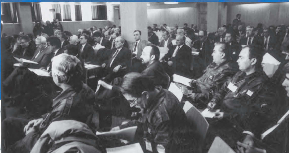
Jedna od ratnih sjednica Prvog saziva NSRS