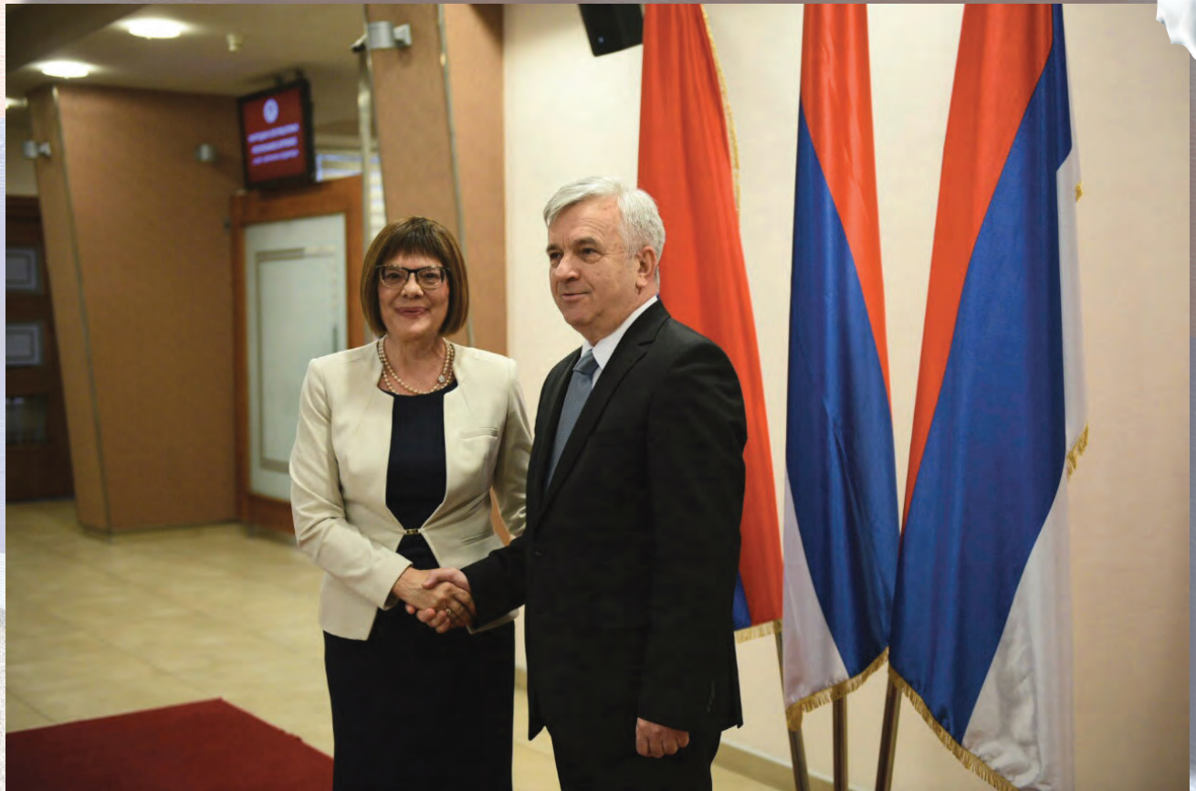
Predsjednica Narodne skupštine Srbije Maja Gojković u posjeti Skupštini Srpske