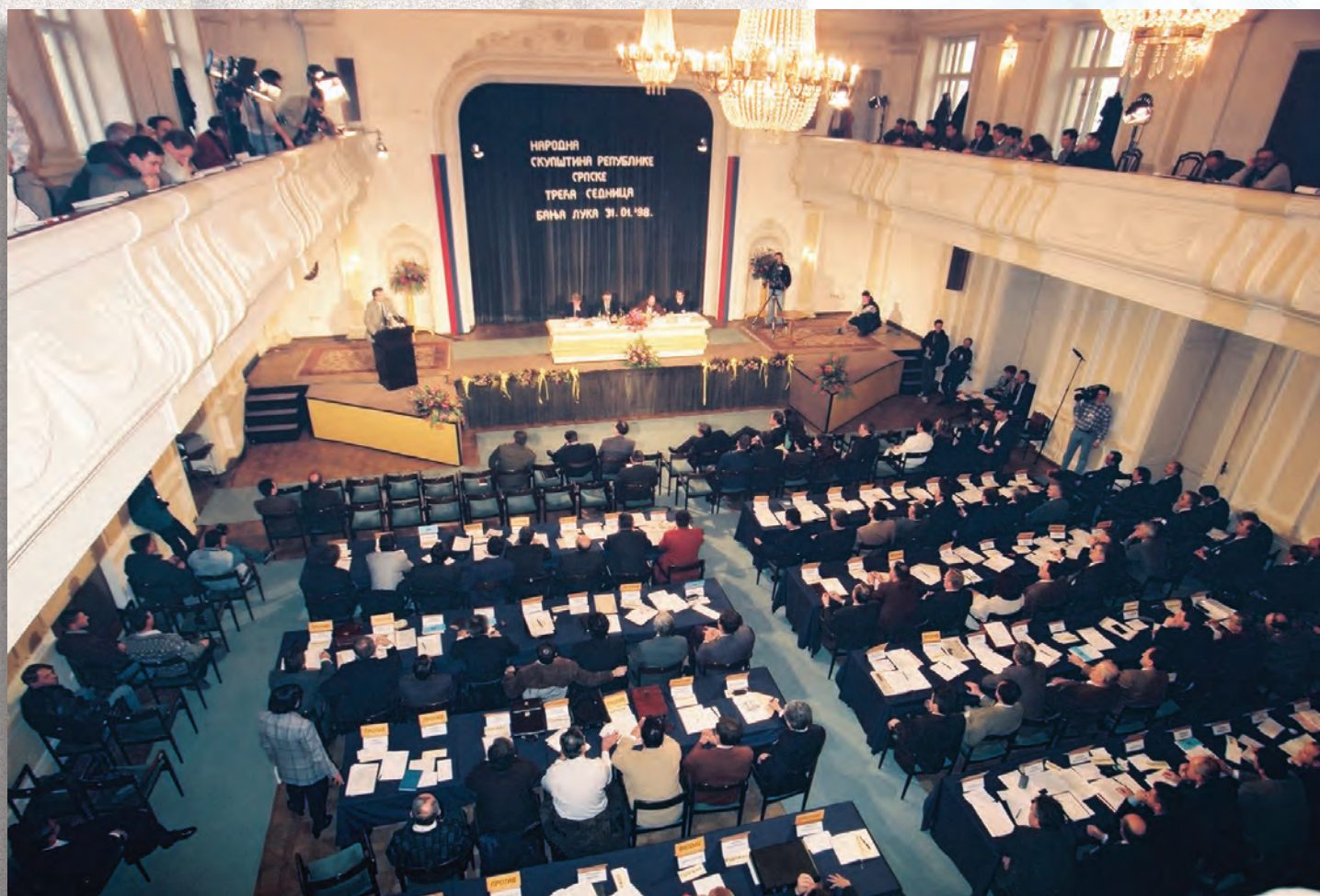
Sjednica trećeg saziva Narodne skupštine u Banjaluci 31.1.1998.