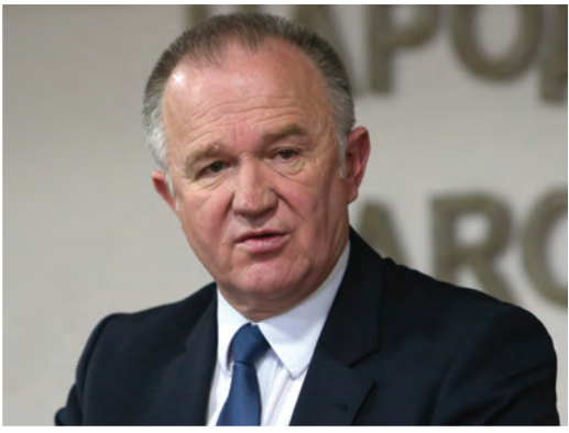
Dragan Čavić (2002. - 2006.)

odlučivanja izmjesti izvan narodnog predstavničkog tijela nije izgubila ni danas. Poštujem tu uzvišenu ulogu koju je imala Narodna skupština i poštovao sam je i dok sam bio predsjednik Republike Srpske.