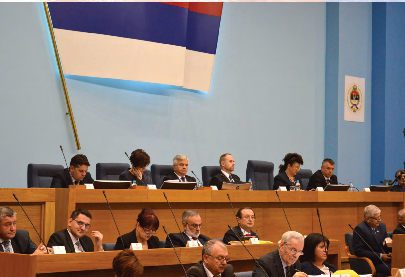
Narodna skupština 25. rođendan dočekuje u devetom sazivu

Piše: Boro Blagojević, pomoćnik generalnog sekretara Narodne skupštine