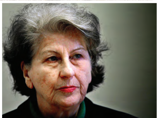
Biljana Plavšić (1996. - 1998.)

Neophodno je da mi u Republici Srpskoj i u budućnosti održimo naše jedinstvo, kako na principijelnim nacionalnim i državnim pitanjima ne bi bilo nikakih razlika. Izuzetno je važno obezbijediti dijalog svih relevantnih političkih faktora u Republici Srpskoj, te graditi zajedničku strategiju da bi Republika Srpska bila osnažena i dobro pozicionirana. Uloga Narodne skupštine Republike Srpske je u tome ključna.