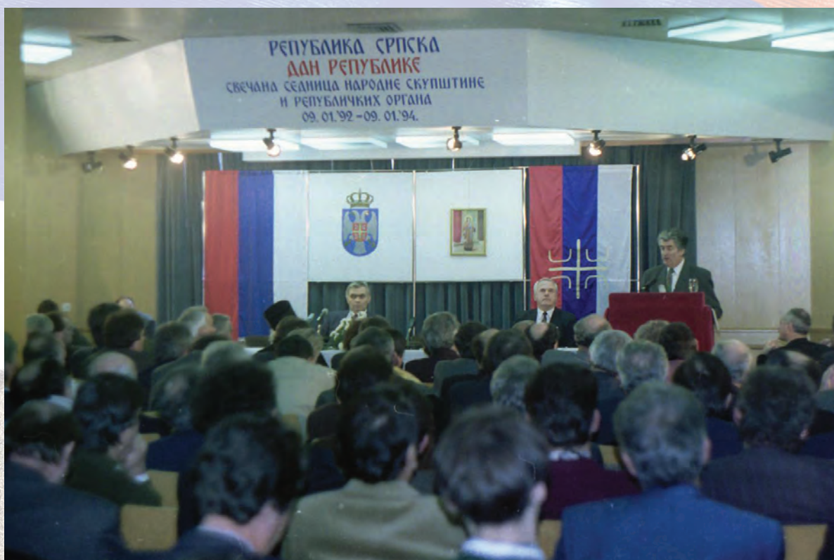
Svečana sjednica Narodne skupštine održana povodom Dana Republike (1994. godine)