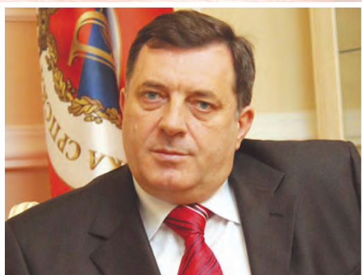
Milorad Dodik, aktuelni predsjednik Srpske

Nezaobilazna činjenica jeste da je Republika Srpska stvorena voljom srpskog naroda, na demokratski način, kako su to činile i mnoge druge zajednice